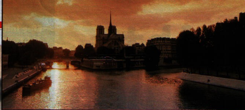
SCHAUPLATZ PARIS Die Geheimnisse der Geschichte reichen bis in die Gegenwart

„Der Leser ist für mich beim Schreiben immer da“