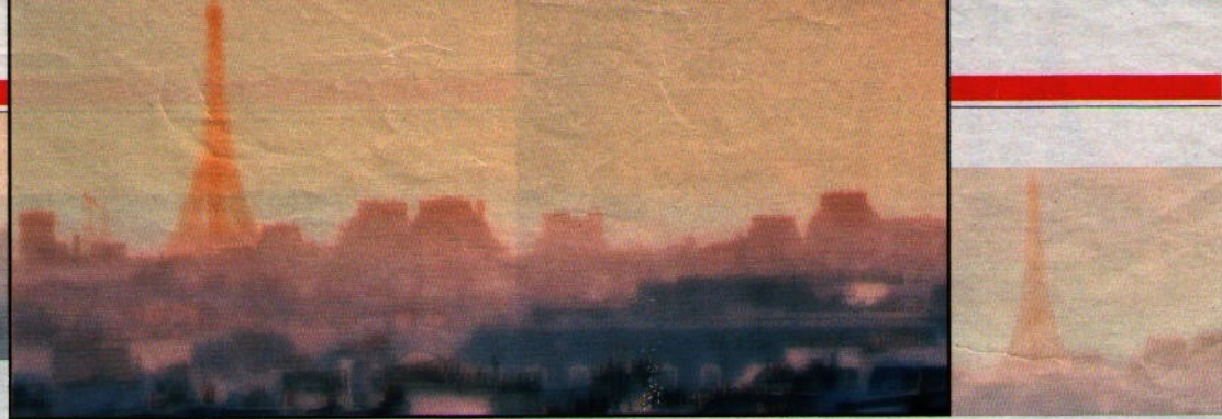
SCHAUPLATZ PARIS Welches Geheimnis verbirgt sich hinter der Kinderleiche in der Seine?